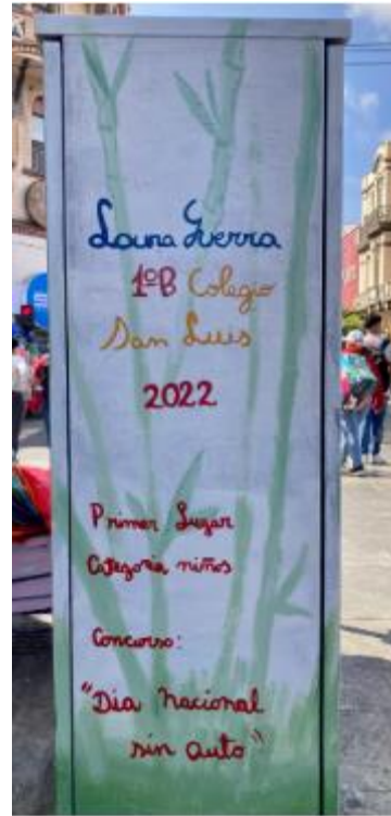
Imagen referencial: Intersección Matta- Baquedano